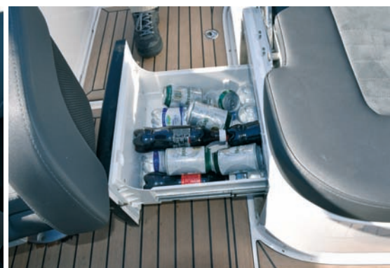
▲ Frižider U sklopu kuhinjsice je i rashladna ladica od 30 litara

Dakle Nordkapp 790 Noblesse je otvoreni gliser od 8,10 metara preko svega, s prilično velikom pramčanom kabinom, velikim kokpitom s puno klupa i jastuka koji su kao stvoreni za ljetno izležavanje.