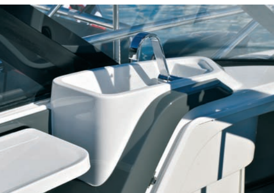
▲ Sudoper Minijaturni sudoper sa slavinom velik je taman toliko da se u njemu može oprati voće