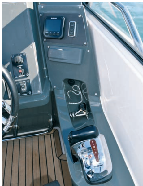
▲ Komande Uredno posložena i pristupačna komanda motora, kontrolni displej motora, radio

Ovoga puta predstaviti ćemo vam upravo jedno takvo plovilo. Nordkapp 790 Noblesse dug je 8,10 metara preko svega, elegantne izdužene linije, relativno niskog profila i s pramčanom kabinom. Norveški proizvođač Nordkapp i ovim je plovilom u svakom pogledu na razini renomea kakvog uživa većina skandinavskih proizvođača. Svaki detalj je dizajnerski pomno razrađen i besprijekorno izveden, a za pogon je odabran izvanbrodski motor Suzuki 300. Već ovih par podataka dovoljno je da možemo reći kako je Nordkapp 790 Noblesse barka koju bi svaki pravi nautičar poželio. Ali krenimo redom. Slikom i tekstem pokušat ćemo vam što više približiti ovo nadasve zanimljivo plovilo.