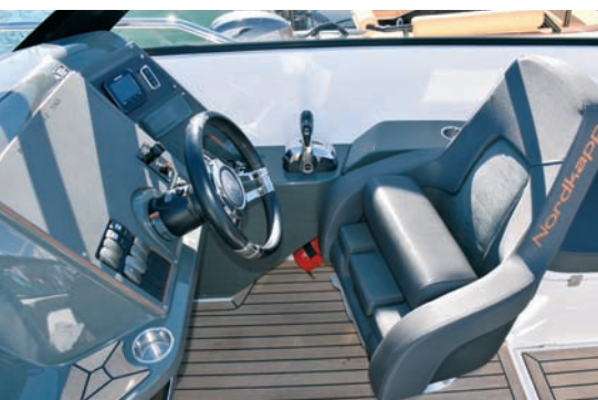
▲ Klupa Skiperska klupa i kolo kormila, široko i ergonomski dobro posloženo