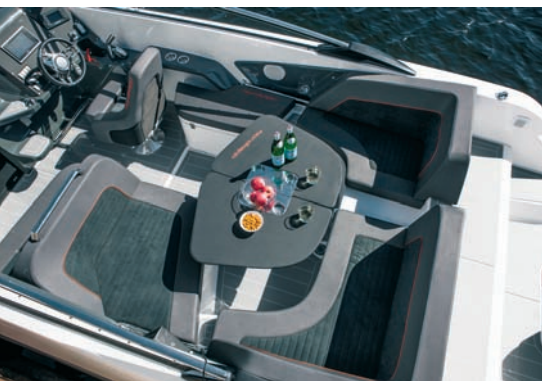
▲ Stolić se montira između krmenih klupa

tikovinom kao uostalom i cijeli kokpit. Ovakav izlaz na palubu je vrlo često rješenje i kod većih posebno američkih plovila, jer se time eliminiraju bočni prolazi, što znači da se dobije značajno veći prostor u kokpitu.