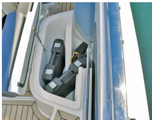
▲ Spremište Ispod klupe je spremište za stvari koje moraju ostati suhe