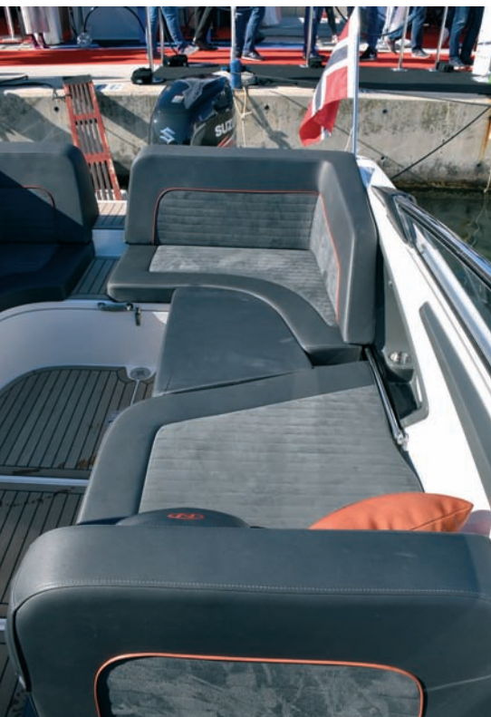
▲ Klupe u krmenom dijelu kokpita, mjesto za opuštanje