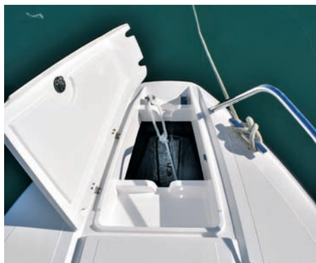
▲ Sidreno spremište Ispod poklopca je skriveno spremište za sidro i lanac, kao i mjesto za ugradnju električnog vitla

Atlantis Marine, Split tel: 021/370-500 sales@atlantis-marine.net www.atlantis-marine.net www.nordkapp-croatia.com