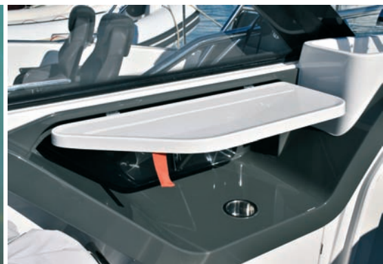
▲ Kuhinja Na lijevoj strani je mini kuhinja, radna površina i mjesto za kuhalo