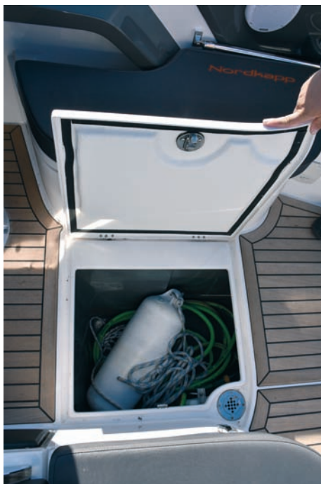
▲ Podno spremište I u podu je spremište za grublje stvari kojima ne smetaju vlaga i voda

prostora za ugradnju velikoga plotera. Desno uz bok su komande motora, radio i displej za kontrolu rada motora.