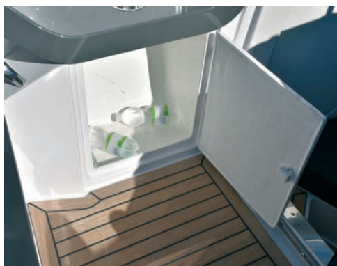
▲ Kuhinjski ormarić Spremište ispod kuhinjsice i sudopera