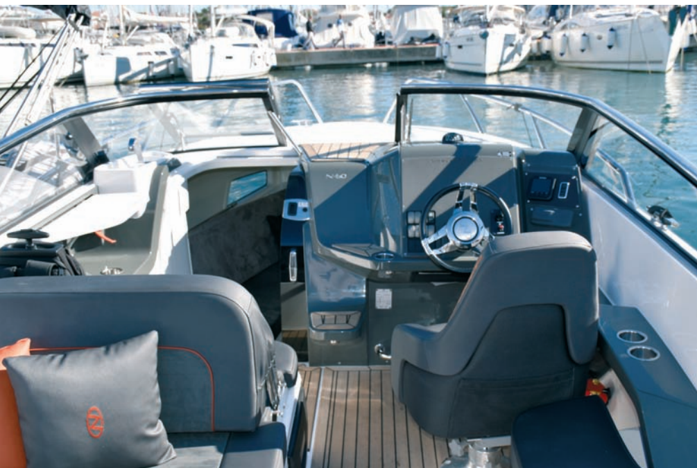
▲ Preklonni vjetrobran Na pramac se izlazi otvaranjem vjetrobranskog stakla