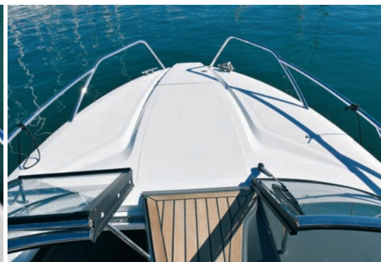
▲ Pramac Izlazi se preko pramca, površina je ravna

sva takva gliserska plovila danas imaju izvanbrodske motore.