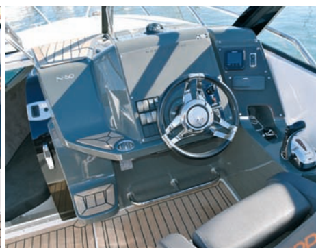
▲ Konzola Upravljačka konzola ima prekidače s lijeve, a sve ostalo s desne strane kola kormila

Ovoga puta predstaviti ćemo vam upravo jedno takvo plovilo. Nordkapp 790 Noblesse dug je 8,10 metara preko svega, elegantne izdužene linije, relativno niskog profila i s pramčanom kabinom. Norveški proizvođač Nordkapp i ovim je plovilom u svakom pogledu na razini renomea kakvog uživa većina skandinavskih proizvođača. Svaki detalj je dizajnerski pomno razrađen i besprijekorno izveden, a za pogon je odabran izvanbrodski motor Suzuki 300. Već ovih par podataka dovoljno je da možemo reći kako je Nordkapp 790 Noblesse barka koju bi svaki pravi nautičar poželio. Ali krenimo redom. Slikom i tekstem pokušat ćemo vam što više približiti ovo nadasve zanimljivo plovilo.