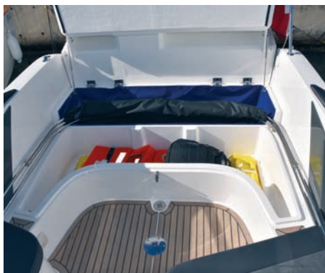
▲ Zanimljivo rješenje Podizanjem krmenne klupe otvara se mjesto za spremanje tende, ali i ostale opreme

Skipersko mjesto je vrlo komotno, s odličnom klasičnom preklopivom klupom, što je danas već postalo standard za brze brodove. Kako je prednji dio upravljačke konzole velik nije problem bio rasporediti sve instrumente i komande za motor, a još je u sredini odmah iznad kormila ostalo dovoljno