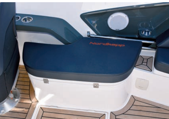
▲ Klupica Iza skiperske stolice je klupa